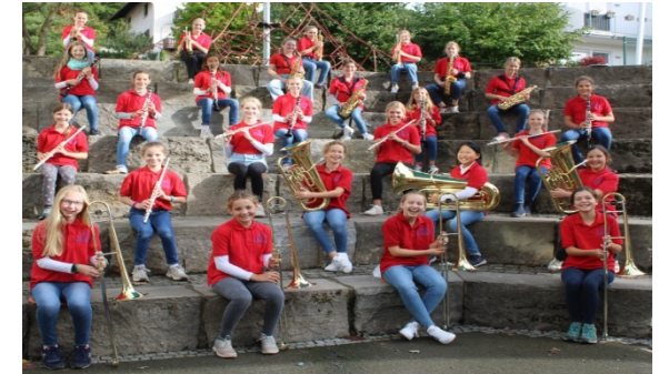
Bläserklasse G 6b Schuljahr 2021/22