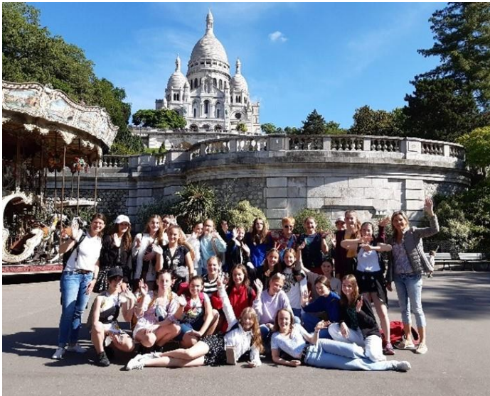
Austausch der G7c (Houilles bei Paris / Collège Sainte Thérèse)